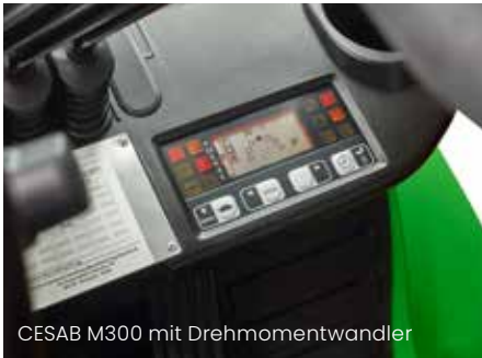
CESAB M300 mit Drehmomentwandler

Der CESAB M300 hat standardmäßig eine vollständige Optionsanzeige, die umgehen alle relevanten Informationen anzeigt. Beim Hochfahren zeigt die Anzeige den Status des Flurförderfahrzeugs, vom Kippwinkel des Hubgerüsts zu Lenkradposition. Damit können die Fahrer eine sichere Fahrt vorbereiten.