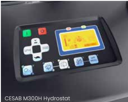
CESAB M300H Hydrostat

Der CESAB M300H hat standardmäßig eine vollständige Optionsanzeige, die umgehend alle relevanten Informationen anzeigt. Beim Hochfahren zeigt die Anzeige den Status des Flurförderfahrzeugs, vom Kippwinkel des Hubgerüsts zu Lenkradposition. Damit können die Fahrer eine sichere Fahrt vorbereiten.